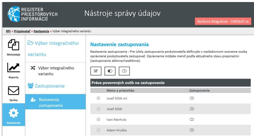
Obrázok 5 Používateľské prostredie „Nástroje správy údajov“ určené na nastavenie zastupovania poskytovateľa priestorových údajov registrovaného v RPI

https://www.slovensko.sk (manuál https://www.slovensko.sk/img/CMS4/Navody/navod_udelenie_zneplatnenie_opravnenia_fo.pdf ) a následne je z množiny používateľov definovaných na https://www.slovensko.sk potrebné vybrať skupinu používateľov, ktorí budú môcť zastupovať organizáciu priamo v RPI. Toto nastavenie sa vykonáva priamo v Nástrojoch správy údajov RPI, kde je z množiny používateľov dostupných na https://www.slovensko.sk možné vybrať len podmnožinu používateľov pre RPI.